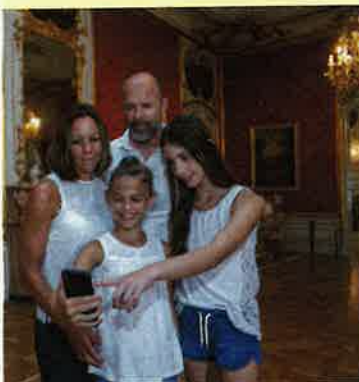
Schloss Ludwigsburg mit Blühendem Barock und Märchengarten